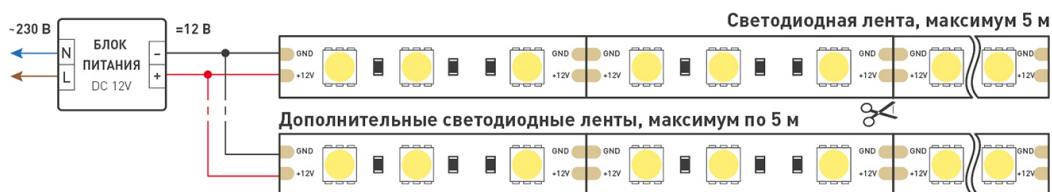
Схема 1. Подключение нескольких светодиодных лент с одной стороны.

Максимальная длина подключения ленты – 5 м (1 катушка).